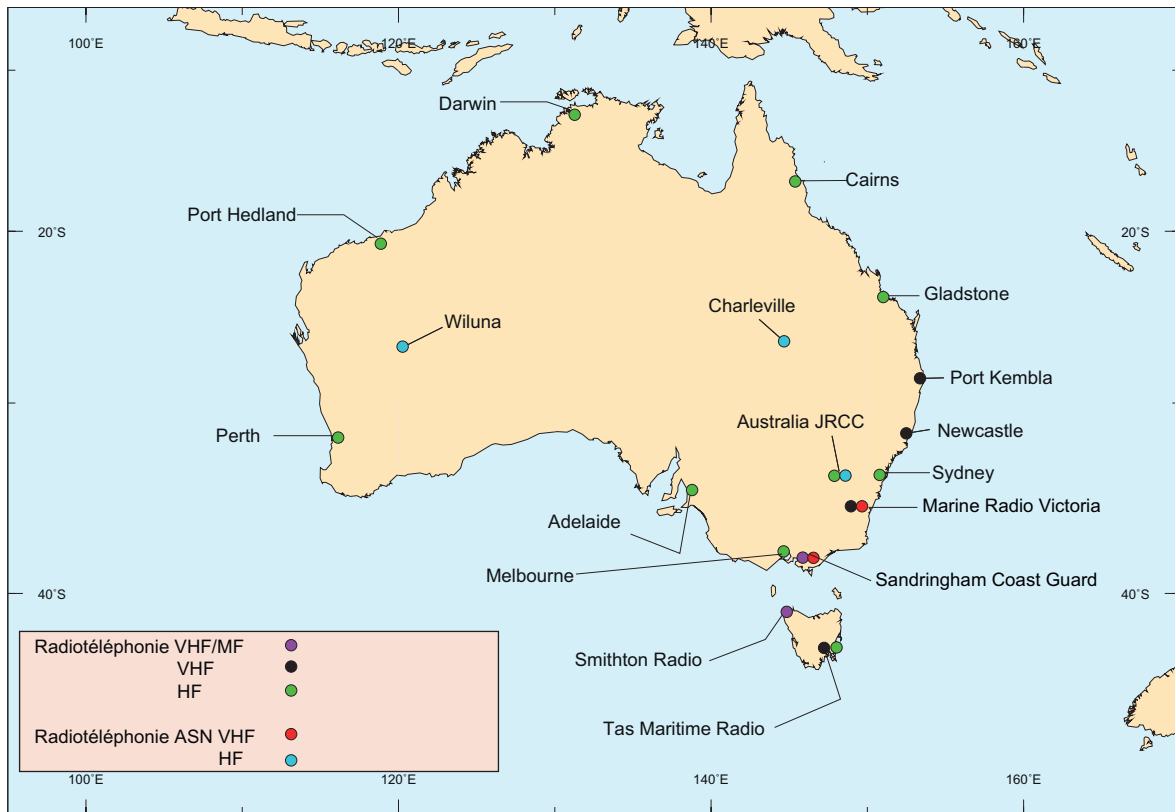
50.AU. — Australie - Stations.