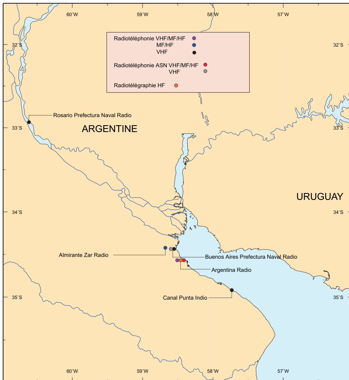
51.AR. — Argentine - Stations.