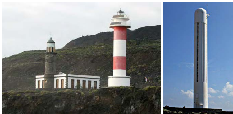
5.2.3. — Punta de Fuencaliente, le phare et l'ancien phare. Le phare de Arenas Blancas (Ldd).

31 La côte à l'Ouest de Punta de Fuencaliente est décrite dans le sous-paragraphe 5.2.1.