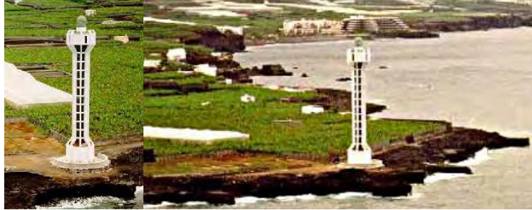
5.2.1.3. — Phare de Punta de Lava (Ldd).