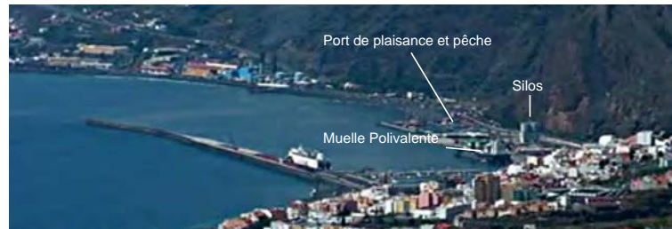
5.2.4.5. — Puerto de Santa Cruz de La Palma (Ldd).