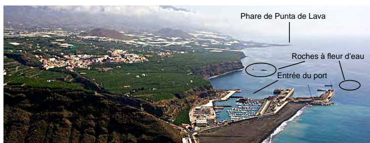
5.2.1.2.A. — Le port de Tzacorte (Ldd).

19 ATERRISSAGE. — Le village de Tzacorte est dominé par Montaña Argual , mont haut de 326 m et plus loin au NE, par Pico Bejanado dont le sommet conique culmine à 1 835 m.